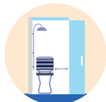
→ Douche de plain-pied