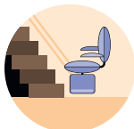
→ Monte-escalier électrique