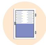
→ Volets roulants électriques