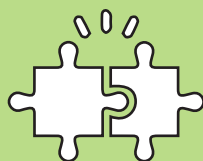
MISE EN COMPATIBILITÉ DU P.L.U.