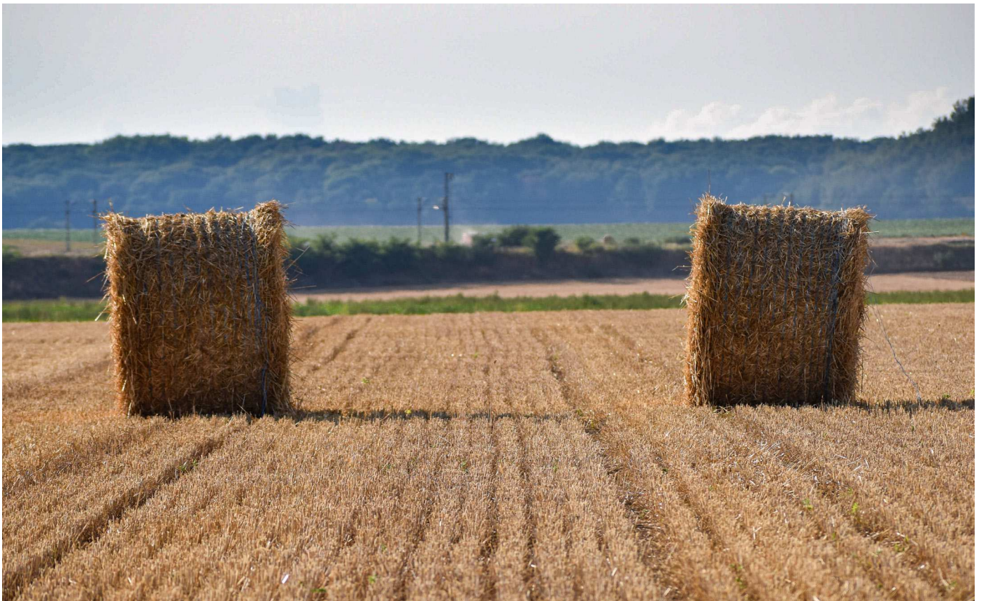
« La moisson »