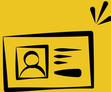
Carte d'identité ou copie recto/verso