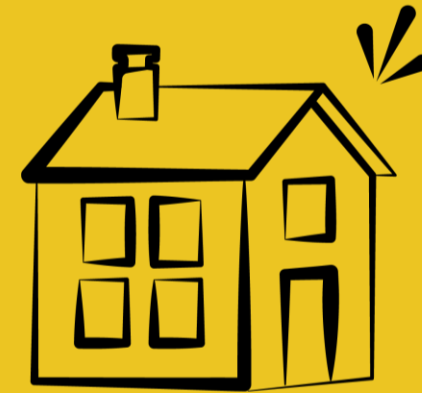
Justificatif de domicile*

*Justificatif de domicile : Avis d'imposition ou facture de moins de 3 mois (eau, électricité, gaz, téléphone, internet) OU Si hébergé/enfant : Attestation sur l'honneur + justificatif de domicile de l'hébergeur