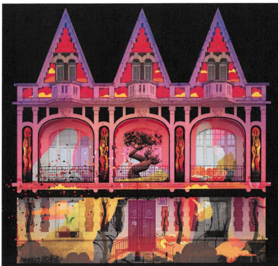
« Vidéo-mapping sur la façade de la mairie, le 7 octobre 2023 »